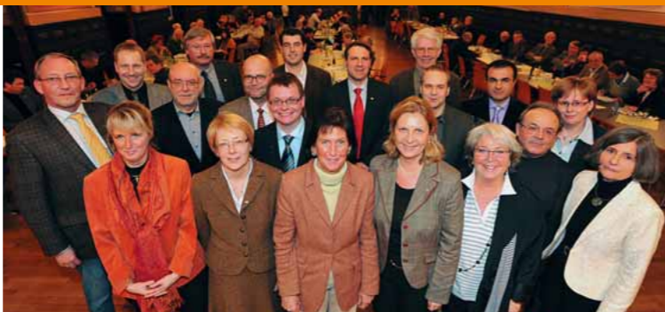
Die CDU-Kandidaten für den Stadtrat: Gemeinsam für Soest!