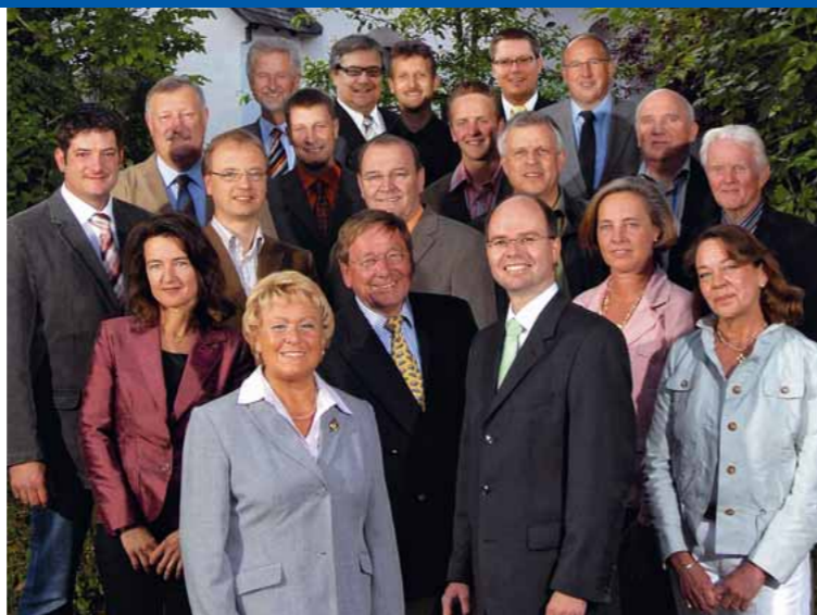
Unsere Kandidaten für den Rat der Gemeinde Möhnesee