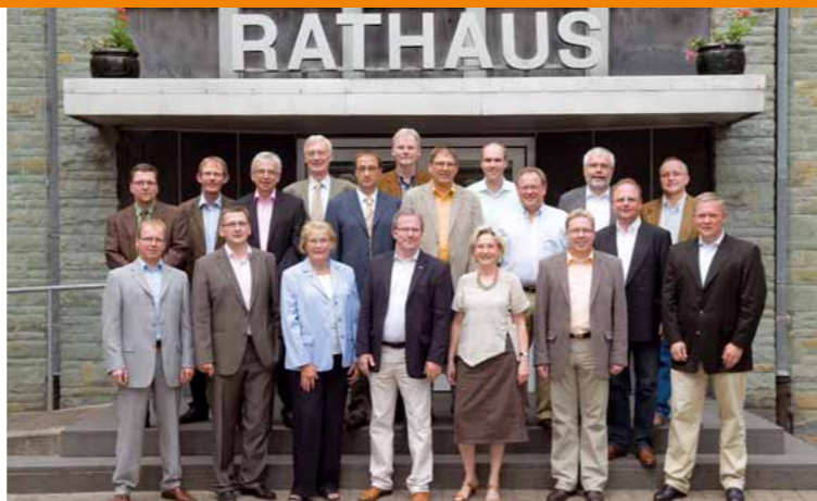
Die CDU Kandidatinnen und Kandidaten für den Stadtrat in Warstein